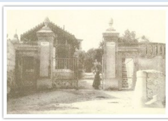
Un'immagine d'epoca: il cancello d'ingresso

N.B. Per motivi organizzativi la premiazione dovrà terminare entro le 17:30 dello 06.01.2026, si raccomanda la puntualità secondo il programma prestabilito.